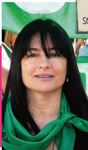
Por Estela Díaz Secretaría de Género de la CTA Nacional